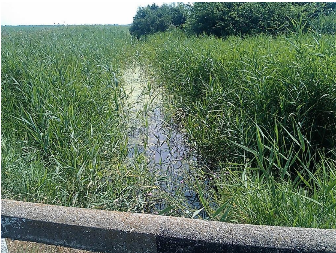
Cigányka ér 17+340 km szelvény, alvízi oldal jelenleg (az épülő vízrajzi mérőállomás helye: 17+332 km szelvény)